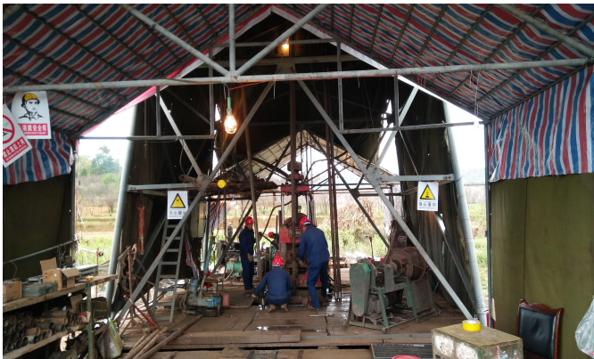
黔兴地1井现场照片