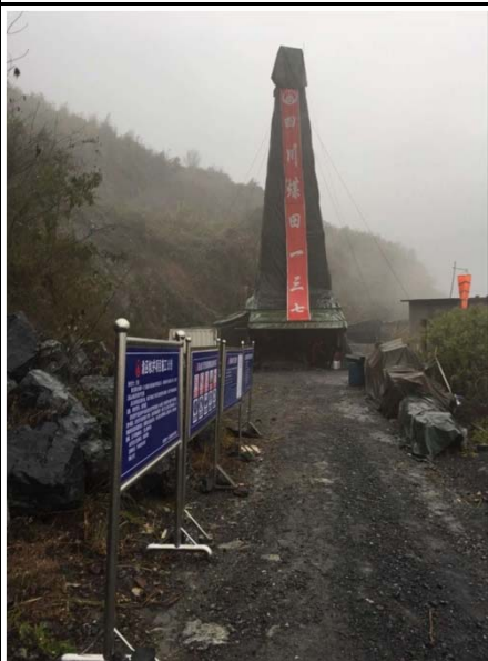
渝巫地2井现场照片