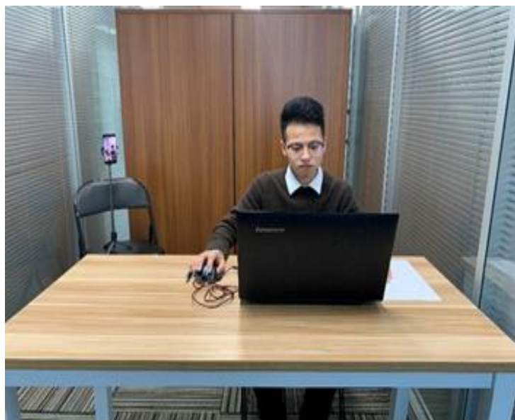
图一：电脑端正面视角

(4) 考试开始前，考生需要先登录移动端“智考通”，用前置摄像头 360 度环绕拍摄考试环境，随后将移动设备固定在能够拍摄到考生桌面、考生电脑屏幕内容、周围环境及考生行为的位置上继续拍摄（详见说明书中《智考通操作手册》《智考云在线考试规范》）。