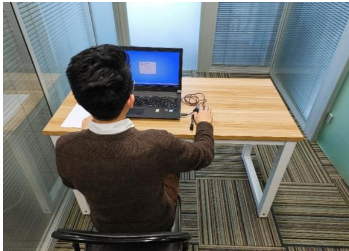
图二：电脑端背面视角